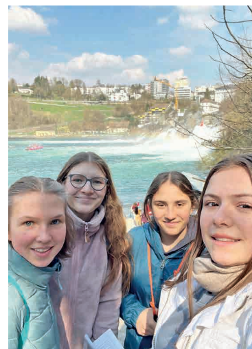
Die strahlenden Zweitplatzierten