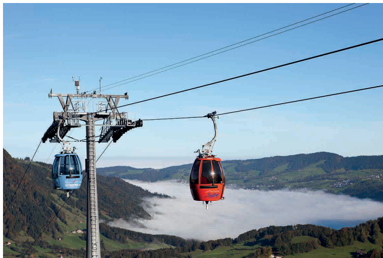
Drehgondeln der Gondelbahn Sattel-Hochstuckli

Um 14.30 Uhr fahren wir mit der Gondel wieder hinunter nach Sattel und steigen in den Reisekar ein. Um ca. 15 Uhr fahren wir auf einer schönen Route entlang dem Äge-