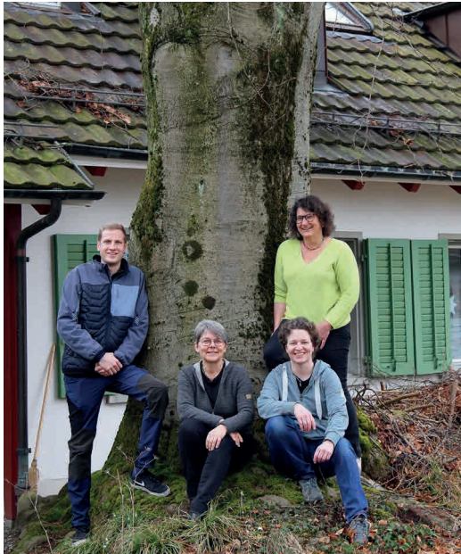
Haus- & Sigristenteam und Team Verwaltung