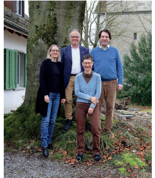
Team Gottesdienst & Musik